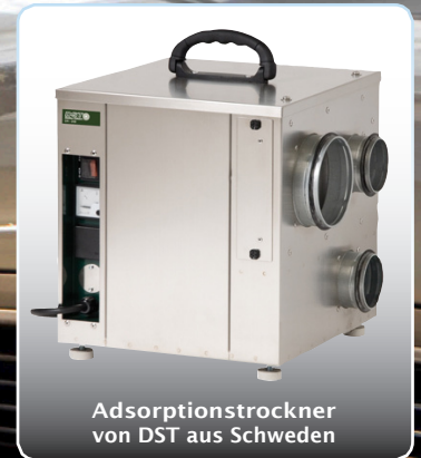
Adsorptionstrockner von DST aus Schweden