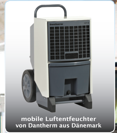
mobile Luftentfeuchter von Dantherm aus Dänemark